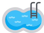
PISCINA CON CLORACIÓN SALINA