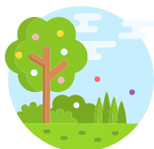
ESPACIOS AJARDINADOS CON ZONAS DE PASEO